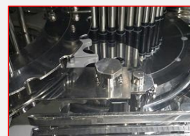
A4-3: Exit Guide