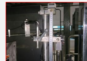
A4-3: Reject Outfeed