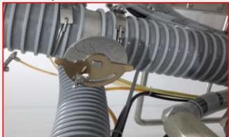
A1 : Cap Air Chute