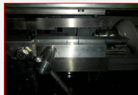
A4-2: Guide Infeed