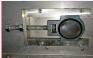
A2-1 : Belt Cap Sorter