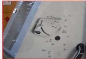
A2-2 : Wavy Guide